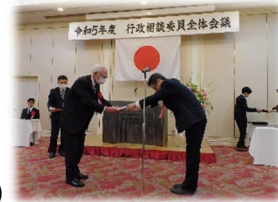
◀令和5年度 全体会議の 様子